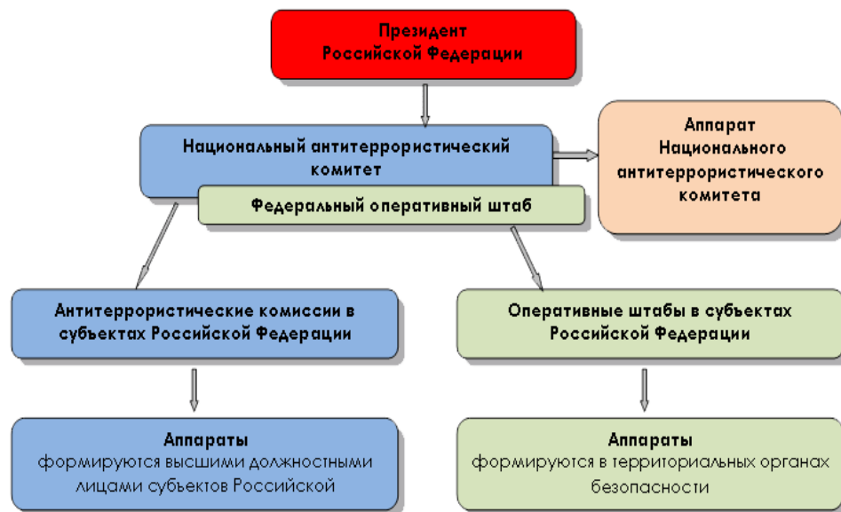
Схема координации деятельности по противодействию терроризму в Российской Федерации

Институты гражданского общества (семья, система образования, СМИ и др.)